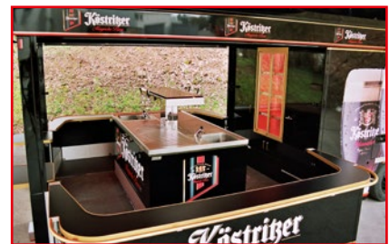
Flaschenkühlregal an der Kühlraumwand

Die gesamte Dachkonstruktion ist beim Transport durch zentralverriegelte Klappen sauber verschlossen.